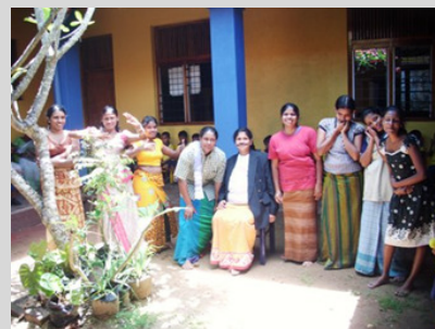
Erzieherinnen bei den Rollenspielen