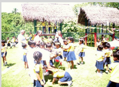
V.l.n.r.: Kinder überreichen den Älteren kleine Gaben als Zeichen der Wertschätzung;

Für die Kinder, wie auch die Senioren wurde so eine „Brücke“ der gemeinsamen Begegnung geschaffen, die generationsübergreifend veranschaulichte, dass Kinder die Zukunft sind, während Ältere mit ihren Erfahrungen der Vergangenheit bereichern. Mit kindgerechten Informationen zum Weltkindertag, zu Themen wie Ernährung, Bildung und Gesundheit sowie gemeinsamem Spielen, Singen und Essen, erlebten die Kindergarten- und Vorschulkinder zusammen mit den Senioren einen interessanten Tag. Den Höhepunkt der Veranstaltung bildeten die eigens von Erzieherinnen und Lehrerinnen einstudierten Geschichten und Rollenspiele, die bei Jung und Alt gleichermaßen für lachende Gesichter sorgten.