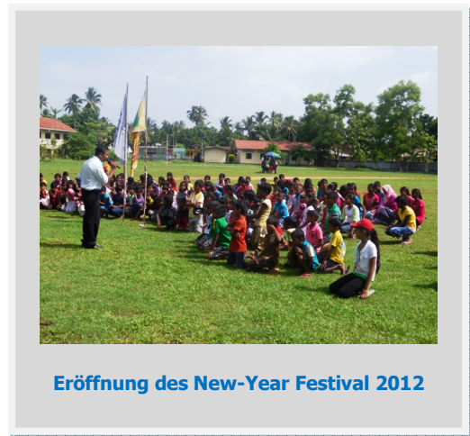
Eröffnung des New-Year Festival 2012

Traditionell feiert man in Sri Lanka im April den Beginn eines neuen Jahres, das „Singhalese New Year“ oder „The April New Year Festival“. Die Bedeutung dieses Festes ist durchaus mit Weihnachten vergleichbar: Man kommt zusammen, feiert gemeinsam und natürlich gibt es auch verschiedene Rituale und Traditionen. Dies nahm auch das Team der Friends Kinderhilfe International in Sri Lanka zum Anlass, am 29. April 2012 ein New-Year-Festival mit unseren rund 150 Patenschafts- und Heimkindern sowie ihren Angehörigen zu feiern. Unter Beteiligung der Kinder wurde ein buntes Programm organisiert, das zunächst traditionell mit einem zeremoniellen Teil startete.