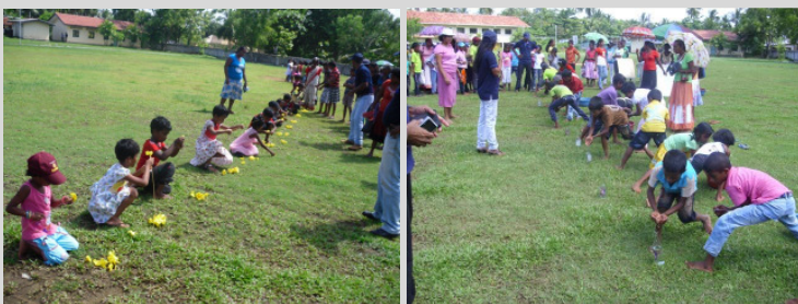
Begeistert wetteifern Kinder aller Altersklassen bei den Spielen

Danach folgten, eingeteilt in verschiedene Altersklassen, Spiele und kleine Wettbewerbe, an denen die Kinder mit großer Freude teilnahmen und die auch FRIENDS-Betreuer und Eltern nicht außen vor ließen.